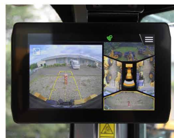
マルチビュー(360度)カメラ