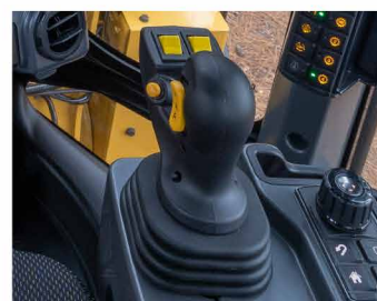
ジョイスティックレバー