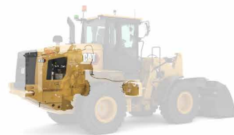
Cat C7.1 ディーゼルエンジン