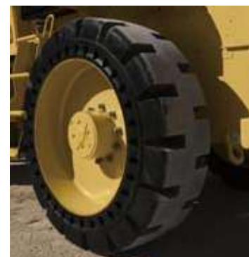
ソリッドタイヤ (トラクションタイプ)