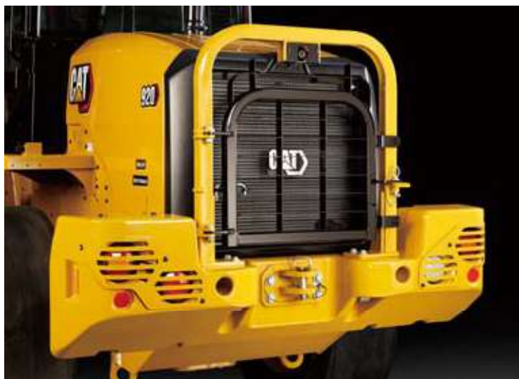
リアドアガードとリアライトガード