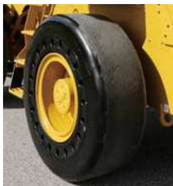
ソリッドタイヤ (スムーズタイプ)