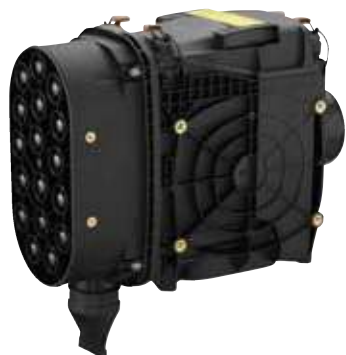
エアクリーナ(フード内吸気)

サイクロン式プレクリーナを新たに装備し、エンジンフィルタへの粉塵の侵入を防ぎます。この革新的なシステムにより、メンテナンスが短時間で、容易になります。